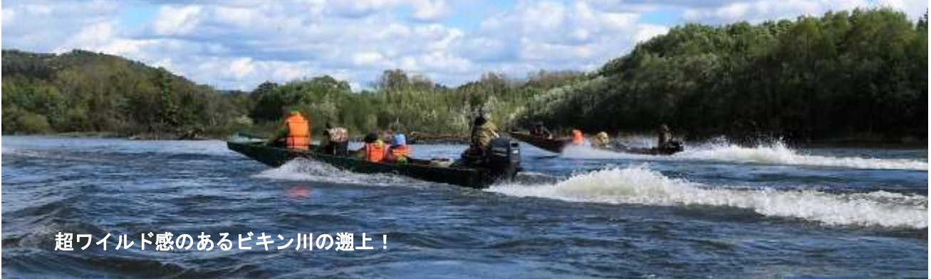
超ワイルド感のあるビキン川の遡上！

4時間半かけてビキン川にかかるタロハ橋に着くと川岸に7隻ほどの川舟と村人が待機していた。村からのお迎えである。ビキン川はアムール川の支流ウスリー川のそのまた支流と聞いていたので小さな川だと思っていたがそうではなかった。かなり川幅が広い。水はいかにもフルボ酸鉄（豊かな海の素、後述）がたっぷり含まれているような緑～茶系の色をしていた。水量も豊富であった。後で日本最長の信濃川よりも長い川（560km）だと知った。川舟に3人程度ずつ分散し、両側に針葉樹と落葉広葉樹の混交林のタイガの森を見ながらヤマハの船外機（40馬力）はフルスピードで村に向かう。舟からは今までに見たことがない景色が続く。