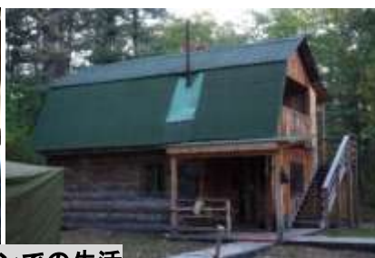
キャビンでの生活