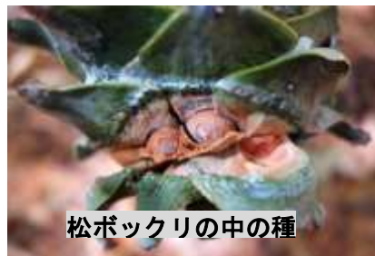
松ボックリの中の種