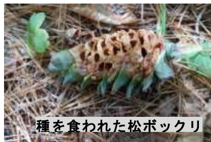
種を食われた松ボックリ