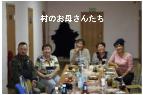
村のお母さんたち

村に滞在中、天気は快晴で寒くもなく最高の日和に恵まれた。村からハバロフスクへの帰路、車窓からは来る時とは違って素晴らしい紅葉（黄葉）が見られた。季節の動きは実に早いものであった。