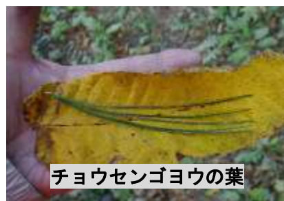
チョウセンゴヨウの葉