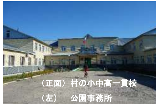
(正面) 村の小中高一貫校 (左) 公園事務所

かつてテレビで世界ウルルン滞在記なるものが放映されていたことを思い出した。毎回日本で活動している芸能人がリポーターとなって海外でホームステイし、様々な事にチャレンジしていく様子をドキュメントとして放送しその中からその国の文化や常識を紹介する。滞在は1週間程度のことが多い。今回はそれを地で行くような感じだった。