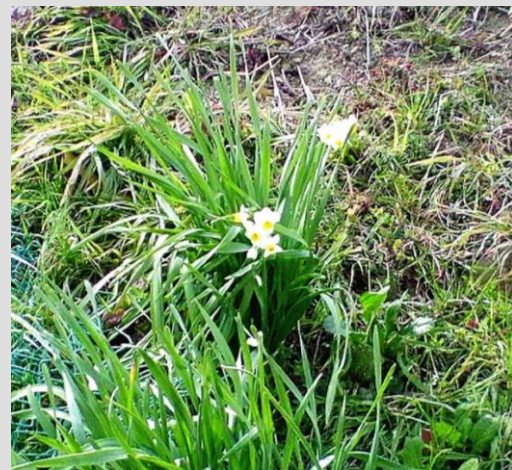
石津川の元気な水仙です。